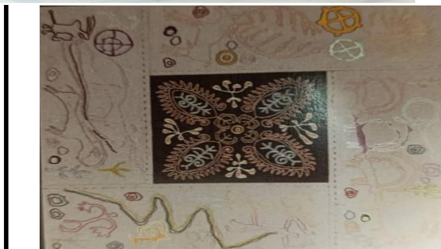
Рис. 1. Авторы панно: Арстанбек Мырзаев, Гулжан Иреш.