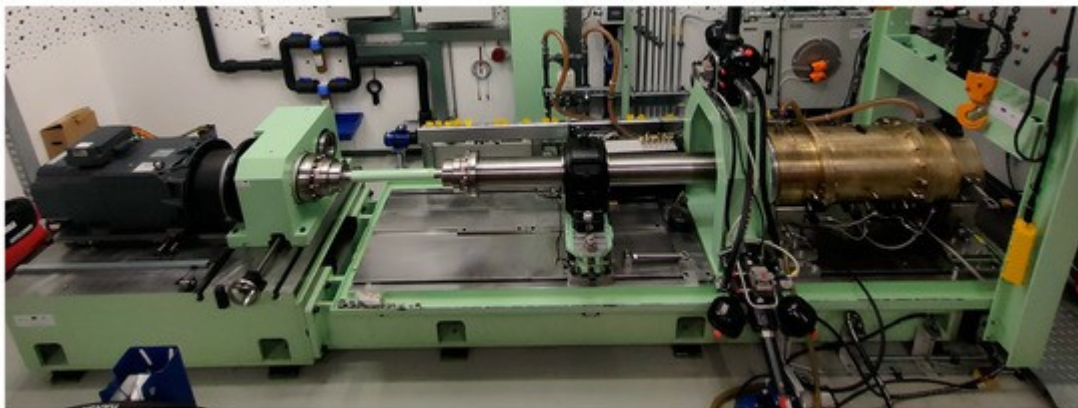
3-rasm. O'lchov asboblari bilan jihozlangan qurilma.

Aylanuvchi mexanizmlardagi nosozliklar aksariyat hollarda birdan paydo bo'lmaydi. Ular sekin-asta shakllanadi va dastlab tebranishning ortishi, shovqinning kuchayishi, temperatura ko'tarilishi yoki quvvat sarfining oshishi orqali sezila boshlaydi. Agar shu bosqichda muammoning ildizi aniqlansa, katta xarajat va avariyaning oldi olinadi. Aks holda kichik buzilish butun agregatning ishdan chiqishiga sabab bo'lishi mumkin.