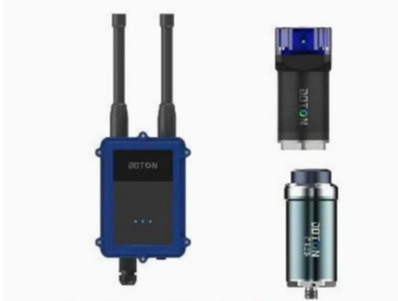
1-rasm. Aqlli monitoring tizimi

Aylanuvchi mexanizmlarda nosozlikni faqat buzilish sodir bo'lgandan keyin bartaraf etish yetarli emas. Zamonaviy texnik xizmat ko'rsatish tizimlari muammoni erta aniqlash va rejalashtirilgan profilaktika asosida ishlaydi. Bunday yondashuv uskuna resursini uzaytiradi, rejalashtirilmagan to'xtashlarni kamaytiradi va ta'mirlash xarajatlarini sezilarli qisqartiradi.