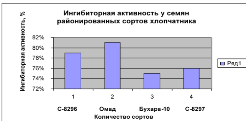
Рисунок-2. Ингибиторная активность у семян районированных сортов хлопчатника