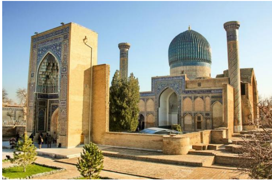
1-rasm. Amir Temur maqbarasi, Go'ri Amir(XIV asr oxiri -1405 y.)

Maqbara, o'rtasida Samarqandning janubiy-sharqiy qismida, Temurning nabirasi Muhammad Sulton tomonidan, XIV asrning oxirida bino qildirgan majmua qoshida tiklangan. [1].